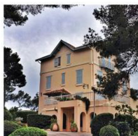
Maison du Patrimoine Corniche des îles Le Brusç 83140 Six-Fours Tel : 04 94 74 96 43