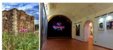
Batterie du Cap Nègre Centre muséologique Parc de la Méditerranée 83140 Six-Fours Tel : 04 94 25 53 84